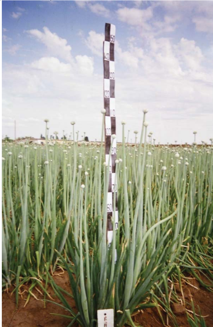
Рис.2. Ураженість насіннєвих рослин весняного садіння маточників масою 100–120 г з площею живлення 560 см 2 (07.06.2005 р.).

На рисунку 2 представлені насіннєві рослини весняного садіння у фазу масового стрілкування з ознаками ураження хворобою в 2005 році.