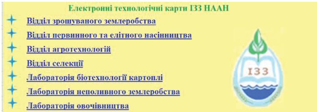
Рисунок 2. Активне вікно головного меню ПК «Електронні технологічні карти ІЗЗ НААН»

допомогою гіперпосилань можна здійснювати перегляд і коригування карт та інформаційних довідників. Користувач може повернутися до головного меню програми зі сторінки змісту виробничого підрозділу (блакитна стрілка з написом «Головне меню» є гіперпосиланням).