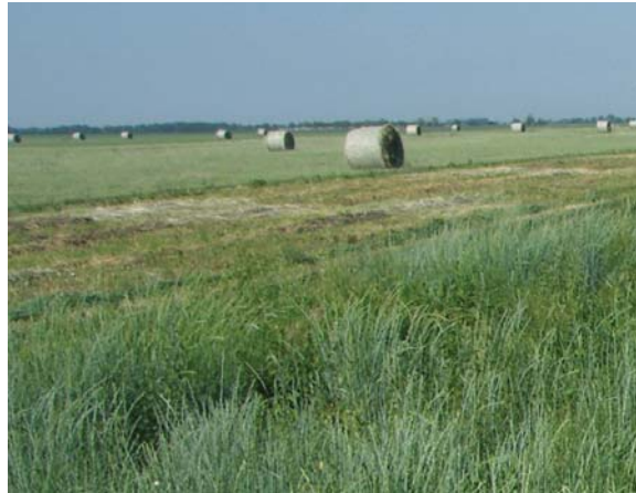
Рисунок 3. Заготівля пресованого в рулони сіна з пирію середнього сорту Хорс в ДП ДГ "Асканійське" Асканійської ДСДС Інституту зрошуваного землеробства НААН (2011 р.)

Одним з основних регульованих чинників, які сприяють підвищенню урожаїв кормових культур в ДП ДГ "Асканійське", є зрошення. Площа зрошуваних земель в 2010-2012 рр. в господарстві складала 4974 га, в тому числі для вирощування кукурудзи на зелений корм і силос – 333-488 га; кукурудзи на зерно – 321-422 га. Врожайність кукурудзи молочно-воскової стиглості (при використанні на силос) за роки досліджень досягала – 14,3-15,5 т/га, кукурудзи на зерно – 4,78-5,80 т/га.