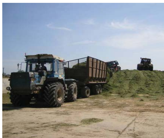
Рисунок 2. Заготівля сінажу з люцерни в ДП ДГ "Асканійське" Асканійської ДСДС Інституту зрошуваного землеробства НААН

визначається загальною потребою тваринництва в кормах. Вказана технологія дозволяє заготовляти грубі корми високої якості з мінімальними втратами при збиранні вирощеного врожаю, а також при його зберіганні і згодовуванні худобі (рис. 2).