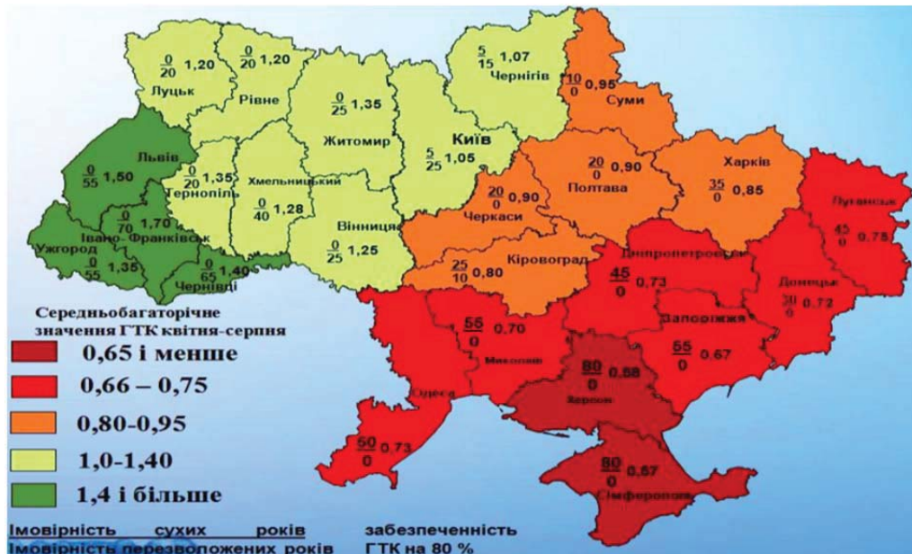
Рисунок 1. Гідротермічна характеристика областей України (розроблено вченими Інституту водних проблем і меліорації НААН)

вного управління водним господарством. Тим самим створити умови для сталого соціально-економічного розвитку сільських територій. Питання відновлення та розширення площ зрошення в умовах Південного регіону України залишаються актуальними.